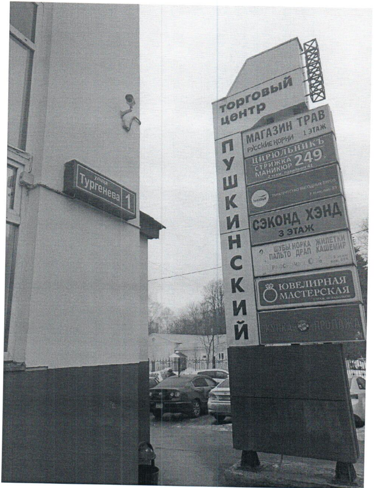
ФОТО № 1